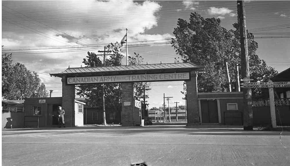
#32 BTC in Peterborough.