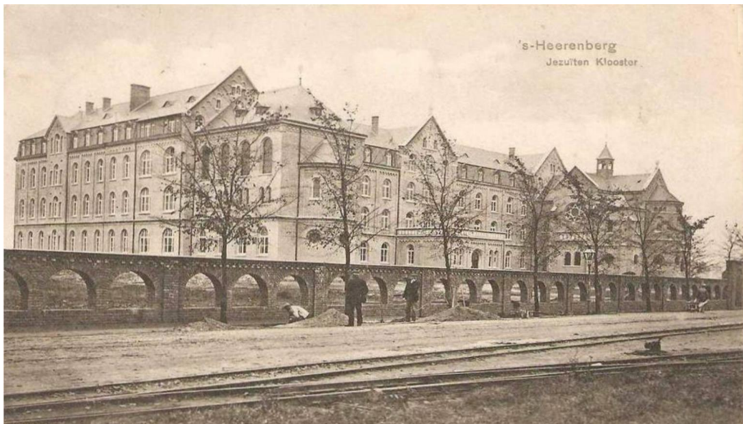
Patersklooster te 's-Heerenberg